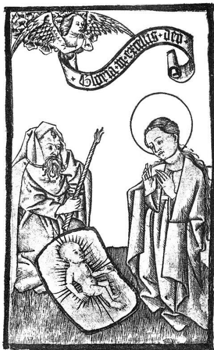
Geburt Christi, Kupferstich, um 1450

Du, Maria, wirst ein Kind empfangen, einen Sohn wirst du gebären: dem sollst du den Namen Jesus geben. Er wird groß sein und Sohn des Höchsten genannt werden.